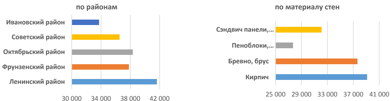
Рисунок 2. Индексы цен предложения жилых домов Иванова и Ивановского района на ноябрь 2018 года

Основными материалами стен являются кирпич (44% от всех предложений) и бревно с брусом (42% от всех предложений), газобетон, блоки, каркасные дома еще не получили распространение, и они вместе занимают всего 14% от всего рынка предложений. По площади основная масса домов представлена в диапазоне 50 – 100 кв.м., а на дома до 150 кв.м. приходится почти 60% всех предложений, но и рынок домов больше 250 кв.м. является большим и составляет почти 20%. Что касается стоимости: большая часть — это дома стоимостью от 1 до 4 млн. руб.